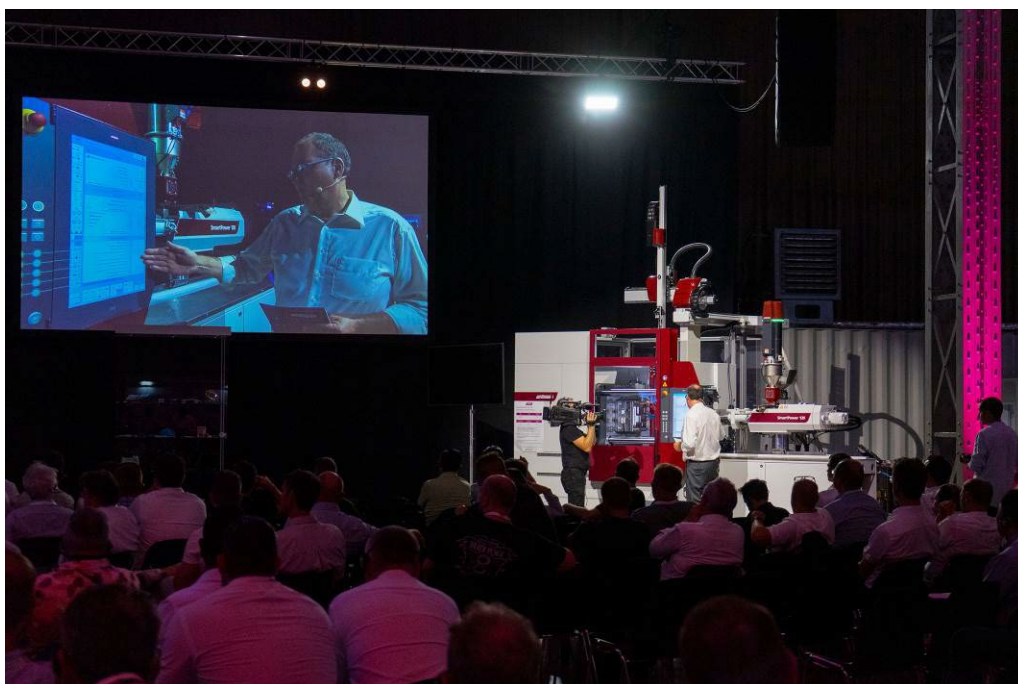
Abb. 3: Die Fachvorträge standen unter dem Schwerpunktthema Digitalisierung