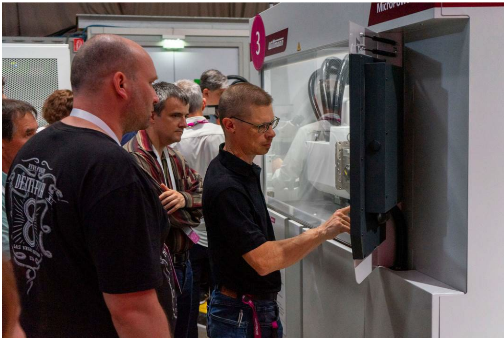
Abb. 4a-d: Die Besucher konnten sich anhand einer Vielzahl an interessanten Exponaten von der Kompetenz der WITTMANN Gruppe überzeugen